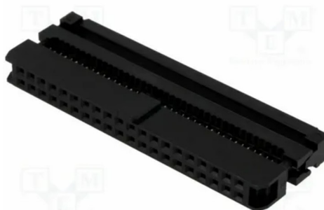
Фигура 2: IDC-40F

Нужно учитывать что распиновка (DIP-40 на шлейф) такого разъема отличается от общепринятых и следует придерживаться приведенному в разделе 5 описанию.